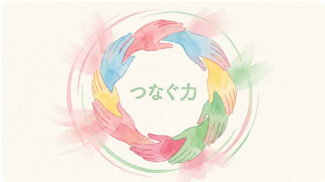
Ch.3 人と人をつなぐ力